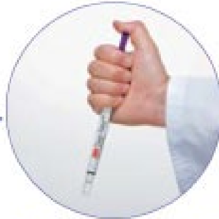
スワブをチューブに戻し 紫色のスティックを押し込む