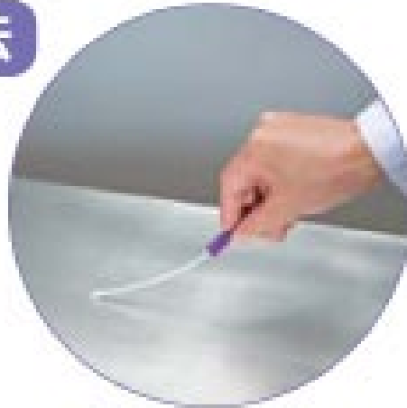
スワブを取り出し 表面を拭き取る