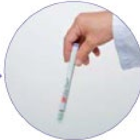
最低5秒 良く攪拌させる